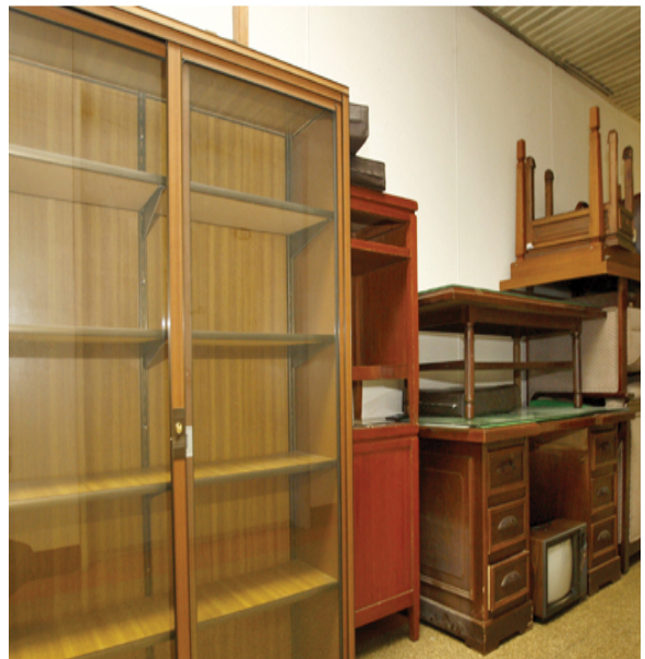
지난달 31일 국회 본청 지하복도에 사용하는 데 아무 지장이 없는 국회사무처의 사무용 가구가 새것으로 교체하기 위해 쌓여 있다.