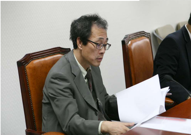
2. 기초연설 중인 권택기 의원님