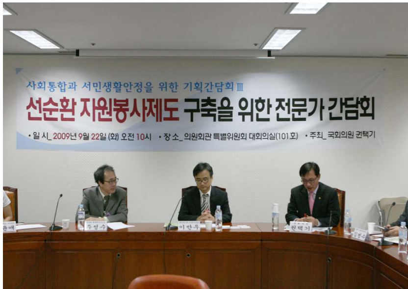
1. 간담회를 시작하며