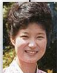
새마을 봉사단 총재 박근혜